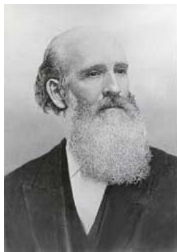
James Springer White (1821-1881)